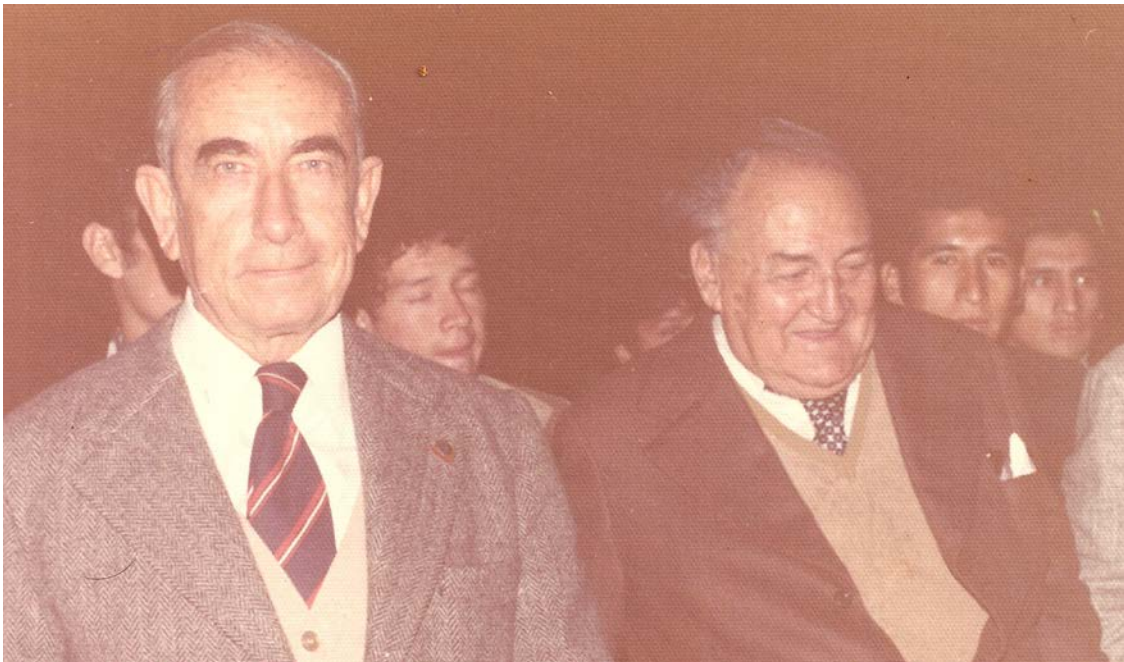
Andrés Townsend y Víctor Raúl Haya de la Torre en 1976

Muchos demócratas de América Latina recuerdan cada 23 de marzo la vida y obra de Andrés Townsend Ezcurra, pensador, maestro y político peruano ejemplar, de obra fructífera y moral intachable, recordado con cariño y aprecio por sus amigos y seguidores y con respeto por sus adversarios.